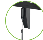
Mecanismo de liberación y bloqueo al instante