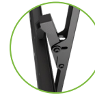
Sistema de agarre fácil y efectivo