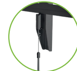
Mecanismo de liberación y bloqueo al instante