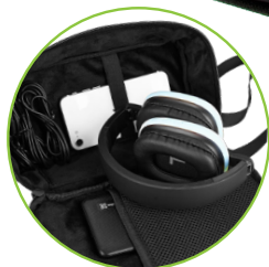
* Las imágenes e ilustraciones son solo de referencia. Accesorios no incluidos.