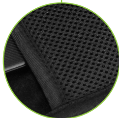
Bolsillo de malla para tener todo a la vista y en orden