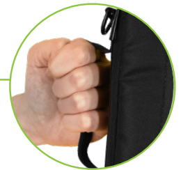
Correa desmontable para llevarlo al hombro o como bolso de mano