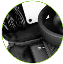
Bolsa organizadora para tus accesorios tech

Organizador para accesorios tecnológicos